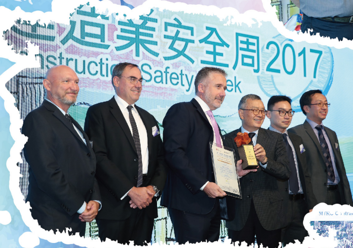
MTR's Citiflow, H28 - SOV TO ADMIRALTY TUNNELS