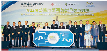
第23屆公德地盤嘉許計劃頒獎典禮

由發展局和建造業議會合辦的「建造業安全周2017」展銷活動「第23屆公德地盤嘉許計劃」頒獎典禮，透過表彰業界優秀榜，推廣工地安全意識，以及加強與僱主的合作關係，計劃表表對業界的廣泛支持，參與約的工務項目由第一屆的26個增至至目前的323個，令人鼓舞。今年計劃共有49個工地獲獎，工務和非工務工程工地分別佔29個和20個。